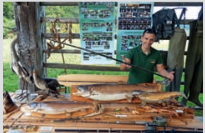
Na pikniku je bilo mogoče videti tudi originalno ribiško palico, ki jo je imel v lasti Ivan Tavčar.

Sredi septembra je Ribiška družina Visoko v sodelovanju z Zavodom Poljanska dolina pod kozolcem na Visokem pripravila tradicionalni ribiški piknik. Letos je bil vključen v sklop prireditev v okviru Tavčarjevega leta, zato so organizatorji obiskovalcem omogočili ogled ribiške opreme, ki jo je imel v lasti sam Ivan Tavčar, ki je bil strasten ribič. Sončno vreme je privabilo precej obiskovalcev, ki so si za nedeljsko kosilo privoščili hrustljivo zapečene postrvi.