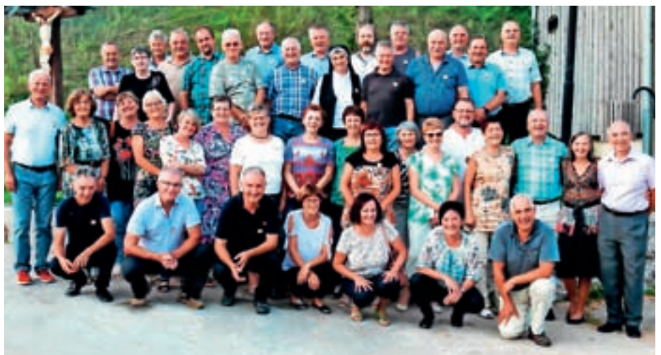
Petdeseta obletnica vajele