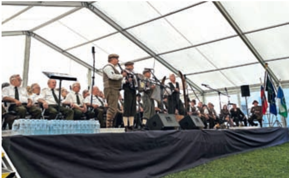
Praznik lovske kulture na Visokem