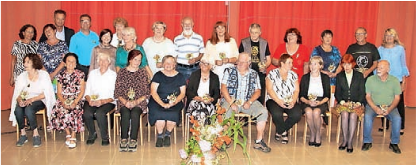
Organizatorji in udeleženci literarnega srečanja

Pod tem naslovom je septembra v Gorenji vasi potekalo že štirinajsto srečanje literarnih ustvarjalcev in ustvarjalk gorenjskih društev upokoencev, izšel pa je tudi zbornik izbranih besedil z enakim imenom.