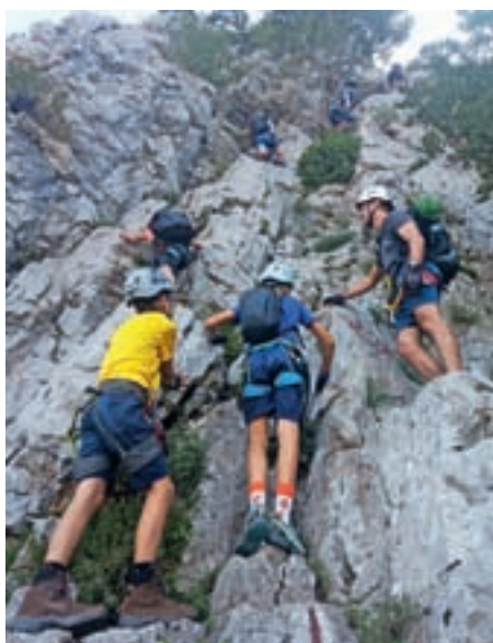
Plezanje na Gradiški turi

Učenci 4. razreda so teden preživeli v plavalni šoli na Debelem rtiču. Glavna dejavnost je bilo plavanje v zunanjem in notranjem bazenu, pouk in delavnice pa so potekale ob obali, v mediteranskem vrtu in gozdičku, pluli so z ladjico, cvrli fritule, igrali športne igre, se vozili s supi in kajaki, izdelovali okvirčke za slike in zadnji večer plesali v otroškem disku. Učenci 6., 7. in 9. razreda so realizirali tehniške dneve. Učili so se o uporabi šolskih e-naslovov, spletnih učilnicah in varni rabi interneta. Šestošolci so se preskusili še v modeliranju in konstruiranju, devetošolci pa v arhitekturi. Lepo vreme so izkoristili za pohode; šestošolci so osvojili Javorč, osmošolci polhograjsko Grmado, devetošolci pa so spoznavali Rupnikovo linijo na Golem vrhu. Učenci