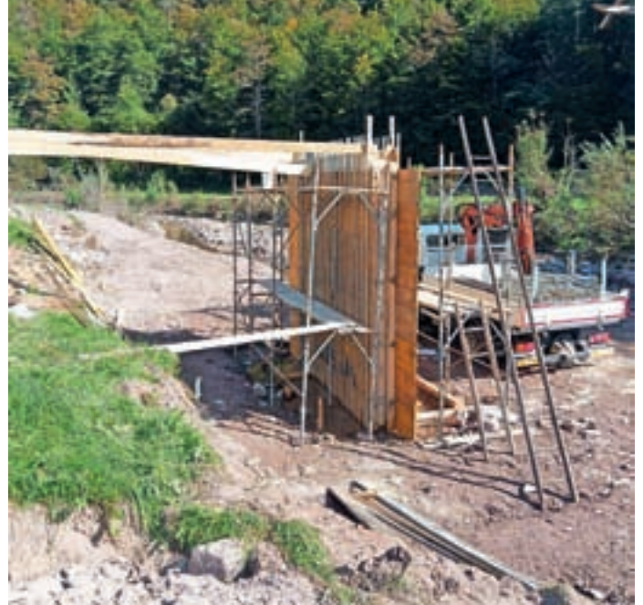
Opornik v Podgori

V porečju Ločivnice želijo temeljito sanirati cesto proti Zakobiljku, kjer bo treba hkrati urediti tudi zaplavne pregrade v globokem delu vodotoka; na cesti za Malenski Vrh jih čaka še sanacija večjega plazu na Lovskem Brdu, urediti želijo cesto v