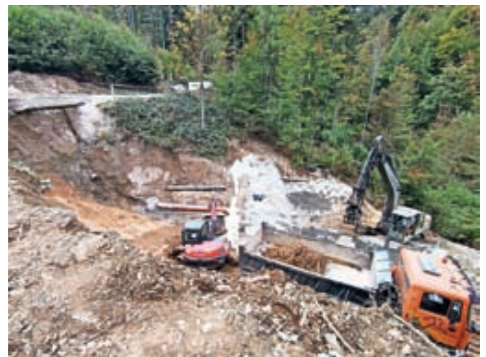
Plaz v Hlavčih Njivah