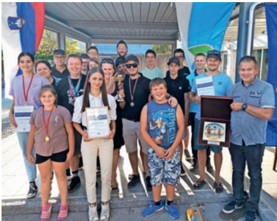
Gorenjevaški strelci ob 70-letnici društva