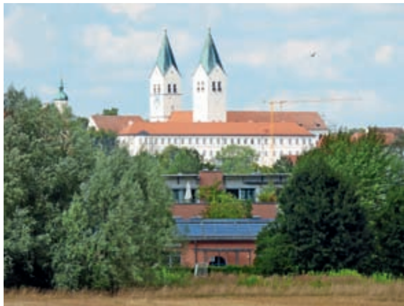
Stolni hrib v Freisingu s stolnico Marijinega vnebovzetja in sv. Korbinijana ter škofijskim dvorcem

Oton II. (rojen 955 – umrl 983) je bil dobro izobražen tako v splošnem kot vojaškem pogledu. Za njegovo nasledstvo je poskrbel že njegov oče Oton I. Veliki. Leta 973, po očetovi smrti, je bil kot vladar sprejet brez nasprotovanj. Leto prej se je v Rimu poročil s Teofano, nečakinjo bizantinskega cesarja Ivana I. Cimiska. Z veliko energije in hrabrosti je kasneje odbijal napade na svojo državo in notranje upore. Leta 980 se je podal v Italijo, da jo dokončno osvoji za cesarstvo. Tam pa je na južni kalabrijski obali s svojo vojsko padel v zasedo, ki so mu jo pripravili sicilski Arabci. Iz bitke se je komaj rešil. V Veroni je leta 983 sklical državni zbor, na katerem so prisotni nemški knezi izvolili cesarjevega sina Otona III. za vzhodnofrankovskega kralja. Še istega leta je zaradi malarije umrl v Rimu in bil pokopan v baziliki sv. Petra. Oton II. je nadaljeval očetovo politiko sodelovanja s Cerkvijo. Krepil je njeno gospodarsko neodvisnost od posvetnega plemstva in postavljaj duhovnike na pomembna uradniška mesta. Ustanovil je več samostanov. Med cerkvenim plemstvom si je izbiral svetovalce, predvsem škofove, in nekaterim zaupal pomembne politične funkcije. Posledica te njegove politike je bila tudi daritev loškega ozemlja škofiji Freising. Prevzemnik darovane posesti Abraham je bil 15. škof v Freisingu (leto rojstva neznano, umrl 994). Službo škofa je opravljal 37