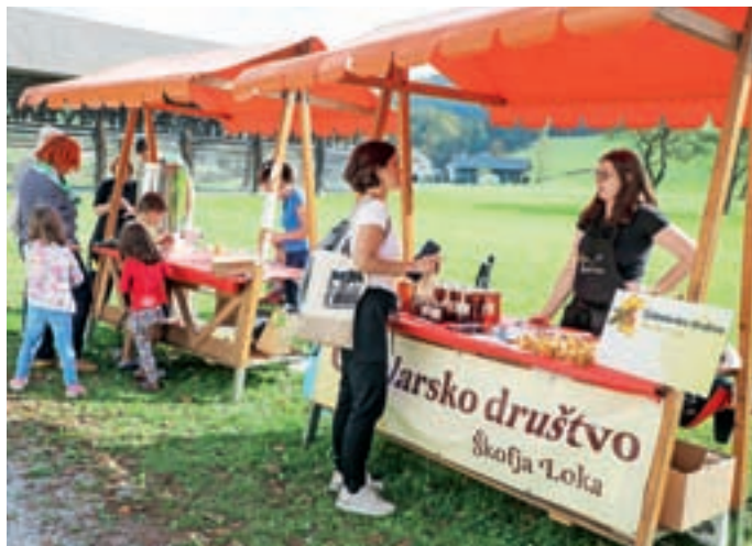
Teden podeželja na Loškem so minulo soboto zaokrožili na Visokem s čebelarsko-kulinarčnim dogodkom.