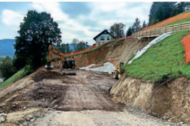
Sanacija plazu v Srednji vasi

Delnice, kjer so sicer najnujnejša dela že izvedena. V načrtu je urejanje ceste v Podobeno in vodotoka ob njej, na obsežnejša dela čaka tudi cesta Poljane–Podobeno, ki jo je poplavilo več hudourniških vodotokov. Sistematično se lotevajo tudi območja Gorenje vasi in obeh Dobrav: protipoplavno želijo urediti vse za- ledne pritoke s severne strani, od Vršajnske grape čez Pretovč do vzhodnih pritokov, na zahodni strani pa vodotok v Grapi, ki je poškodoval skoraj vso infrastrukturo. Čaka jih celovita sanacija infrastrukture ob Todraščici in Brebovščici, kjer želijo nevarne mostove nadomestiti s poplavno varnejšimi in zgraditi zaplavne pregrade. Te manjkajo tudi na cesti Lajše–Žirovski Vrh, kjer bodo izboljšali funkcionalnost globokih prepustov. Za cestno infrastrukturo na območju Hlavčih Njiv čez Brda do Srednje