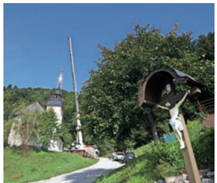
Namestitev štiri tone težke kupole na vrh zvonika je potekala brez zapletov.