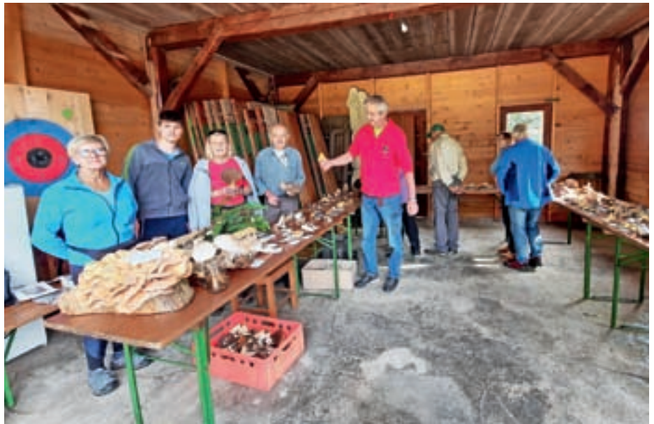
Razstava gob na Ermanovcu

Člani obeh društev so skupaj nabrali 115 vrst užitnih, pogojno užitnih, neužitnih, strupenih in smrtno strupenih gob. Nekaj so jih prinesli tudi obiskovalci. Številni so si čez dan z zanimanjem ogledovali razstavo, včasih kaj vprašali, se čudili posameznim primerkom, pa tudi pomislili, ali sami zadosti dobro poznajo vrste gob, da bi jih nabirali za prehrano. Prvo razstavo so na Ermanovcu pripravili leta 1993. Samo kakšno leto vmes je ni bilo, ker gobe enostavno niso zadosti rasle. Zahtevajo namreč primerno vlago in toploto, nekaj vpliva doda še ustrezna luna. Pri planinskem in gobarskem društvu se z vsakoletno razstavo gob trudijo informirati in tudi izobraziti ljudi, kaj raste v okolici, kaj naj nabirajo in česa ne ter kako zelo je pomembno