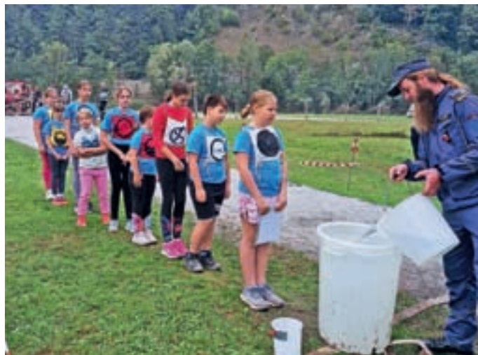
Tekmovanja Gasilske zveze Škofja Loka na Visokem se je udeležilo kar 93 ekip.

Med mladinkami so bile prav tako odlične vse tri ekipe naše občine: tretje Trebijke, druge Sovodenjčanke in prve Poljanke. Mladinci so se potrudili do naslednjih mest: Sovodenjčani do prvega, Poljanci do tretjega, Lučinčani pa do četrtega. Članicam A so stopničke ušle: Lučinčanke so se uvrstile na četrto mesto, Sovodenjčanke pa na peto. Pri članih A so bili najboljši Poljanci, pri članicah B so naša dekleta zasedla tretje in četrto mesto, za las boljše so bile Poljanke pred Sovodenjčankami. Člani B so mestni ravno zamenjali: tretji Sovodenjčani pred četrtouvršče-