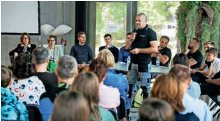
Zaposleni so učencem in dijakom ter njihovim staršem predstavili možnosti raznolikih poklicev v podjetju.