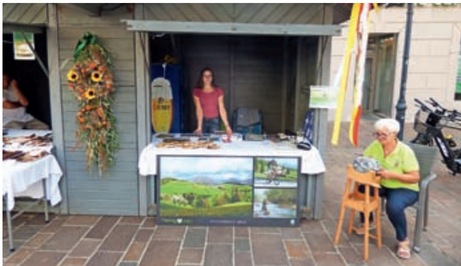
Stojnica Občine Gorenja vas - Poljane je ponujala promocijsko gradivo, informacije, sladke in slane priboljške ter možnost ogleda klekljanja v živo.

V soboto dopoldne je bila prisotna Folklorna skupina Sovodenj, ki je z glasbo in plesom navdušila številne obiskovalce. Izvedli so tudi priložnostni skupen nastop z domačimi ljudskimi godci, kar priča o kompatibilnosti slovenske in koroške tradicionalne glasbe. Številne poglede in veliko zanimanja so s predstavitev klekljanja pritegnile članice Klekljarskega društva Deteljica Gorenja vas. Obiskovalci so lahko pokusili tudi nekaj dobrot iz Poljanske doline.